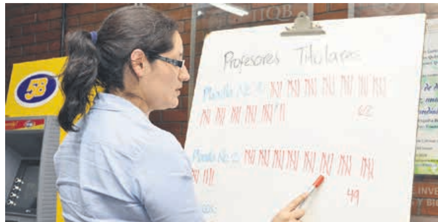
A partir de las 20:30 horas inició el conteo de votos tanto en el campus central como en las distintas sedes que sirvieron para la votación.

El pasado 2 de mayo se realizaron las elecciones para la Rectoría de la Universidad de San Carlos de Guatemala. 170 representantes fueron electos para seleccionar por mayoría de votos a la máxima autoridad de esta casa de estudios.