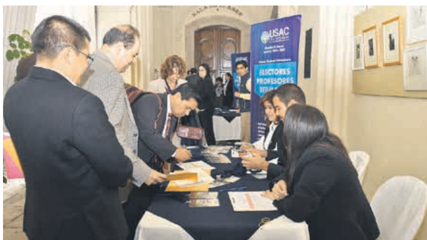
Momento en que los representantes del cuerpo electoral se identifican.

Agregó que en este nuevo capítulo en la historia de la USAC se trabajará por cambios sustanciales y objetivos. “En un país colapsado, en medio de mucha corrupción, la transparencia es un tema fundamental. La única universidad pública, con 342 años de historia, debe trabajar unida, con principios y valores, para que la educación superior sea nuestro mejor estandarte para las generaciones futuras”.