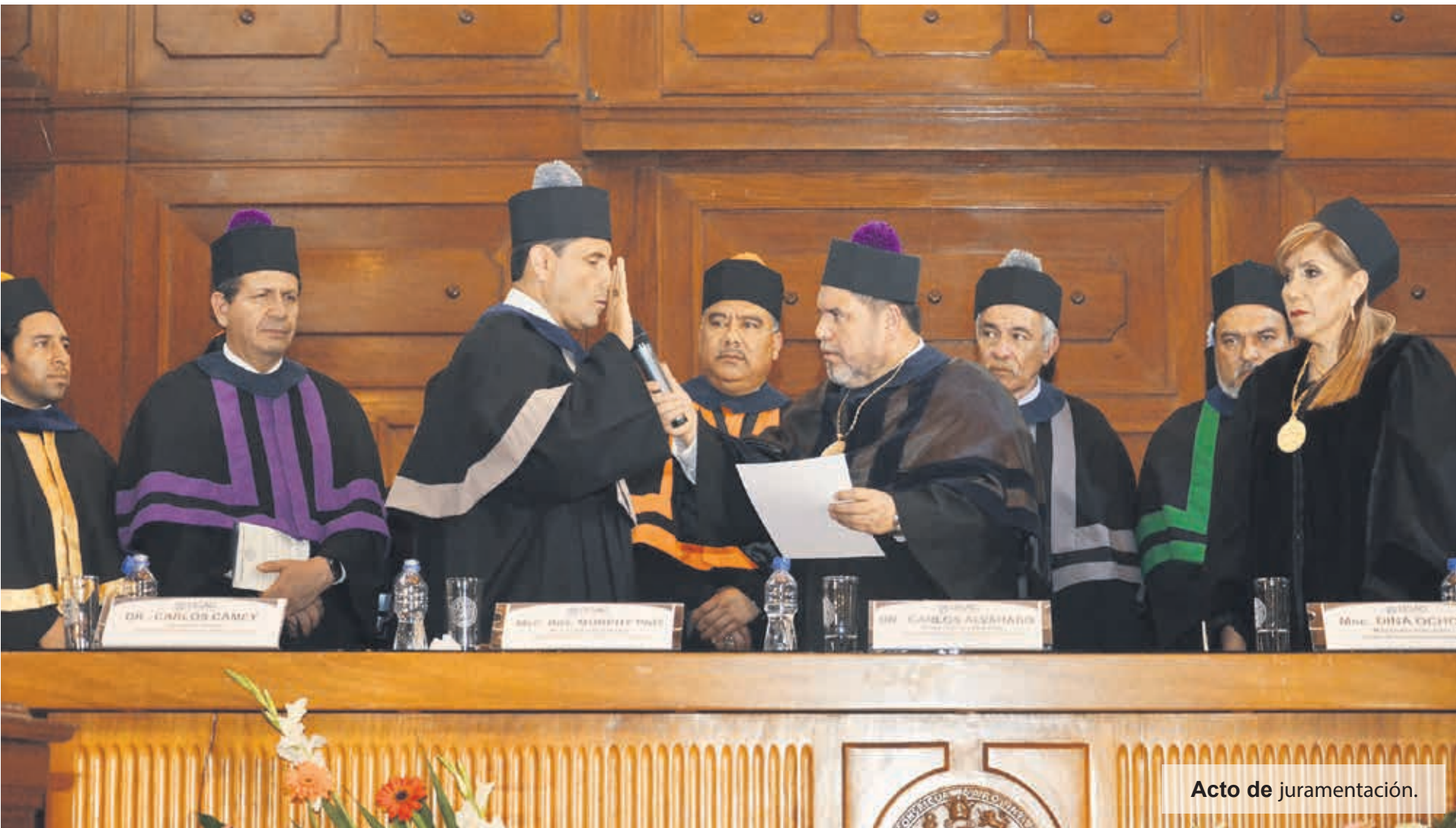
Acto de juramentación.