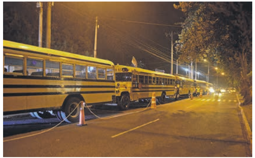
Salida del Centro Universitario Metropolitano (CUM), 20:30 horas.