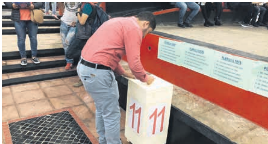
Hasta las 20:00 horas se cerraron las urnas para dar paso al conteo de votos.