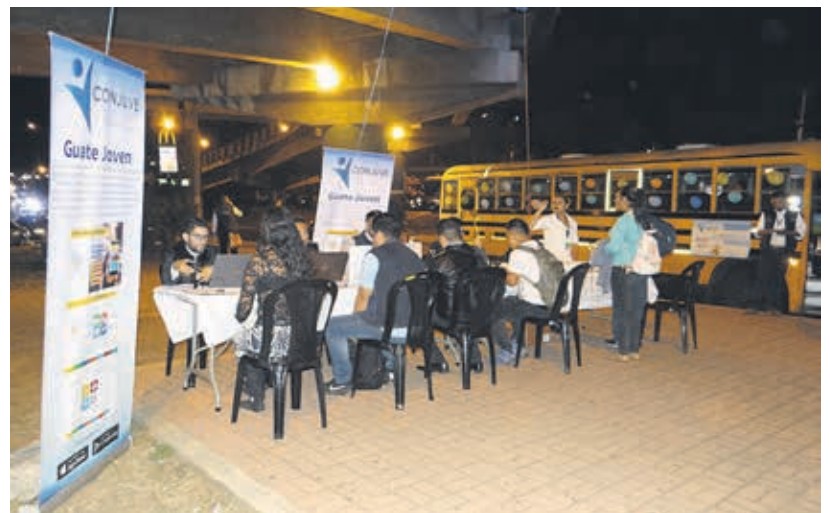
Presentar su carné o DPI, requisito indispensable para utilizar el servicio.