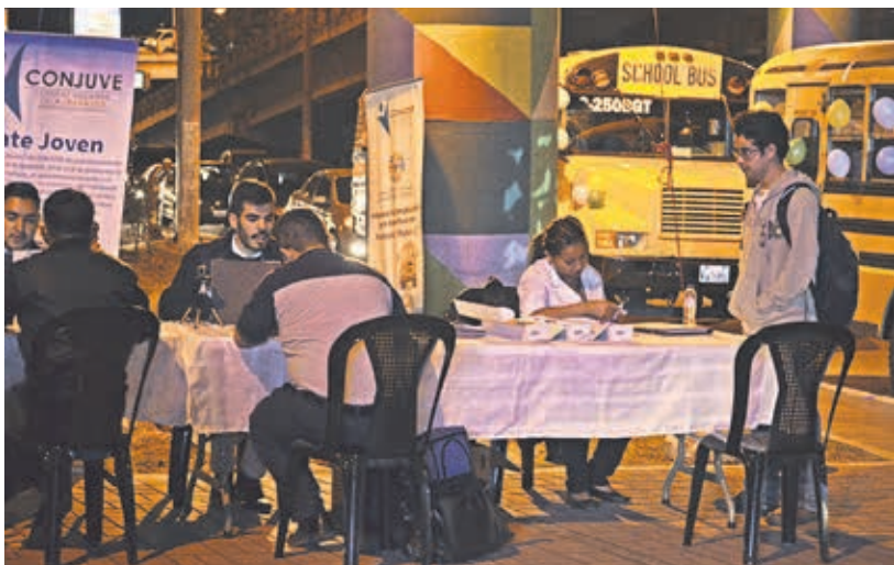
Más de 8000 estudiantes han sido beneficiados con este servicio de transporte.