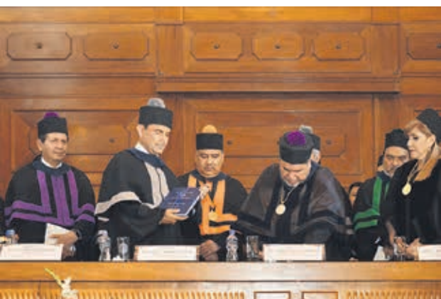
Recibe el libro de leyes de la USAC.

“Creo en la autonomía de la universidad, como condición indispensable para el cumplimiento de sus fines.