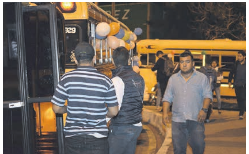
Un total de 63 unidades de transporte al servicio de los sancarlistas.