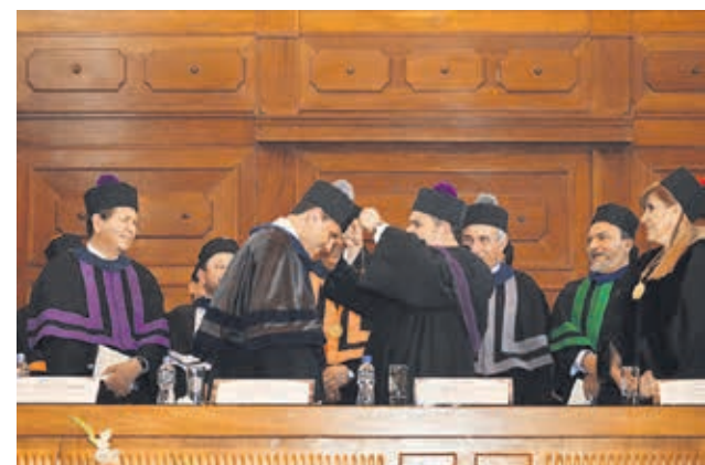
Colocación del medallón de oro.