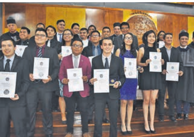
Grupo de estudiantes de las diversas carreras de Ingeniería fueron homenajeados por su calidad académica.

Fue impulsor de las Olimpiadas Interuniversitarias de Ciencias y Tecnología en la USAC. A nivel internacional cuenta con reconocimientos de la Universidad de Ciego de Ávila, la Cátedra de las Ciencias de Cuba y la Unión de Arquitectos e Ingenieros de La Habana.