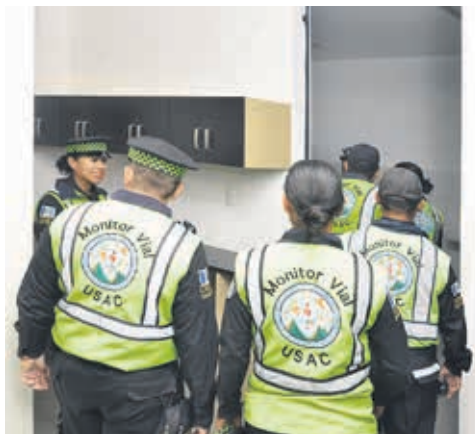
Diversos ambientes del nuevo edificio.