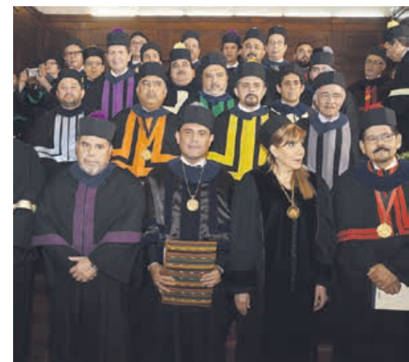
Miembros del honorable Consejo Superior Universitario participaron del acto académico.