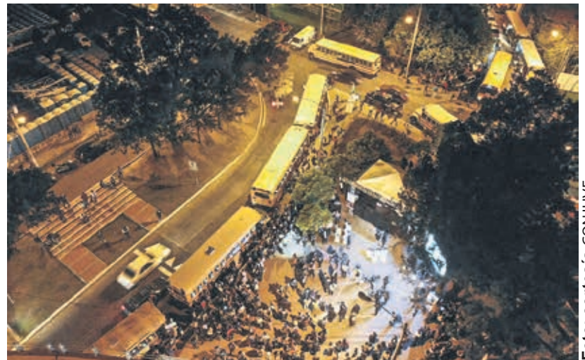
Salida del campus central a partir de las 20:30 horas.