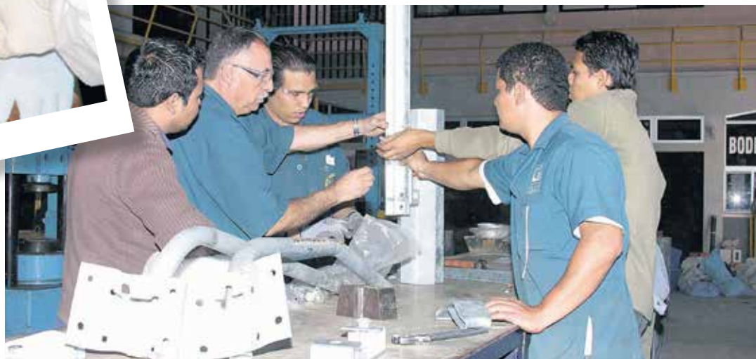
Laboratorio de Ingeniería