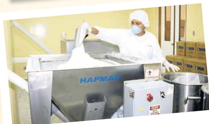
Laboratorio de Suero Oral