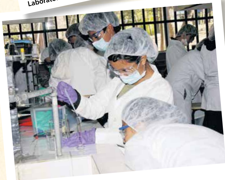
Laboratorio de Agua