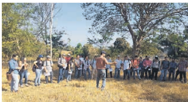
Aspirantes a ingresar a la carrera de Zootecnia, en unidad productiva.

En la carrera de Zootecnia, los aspirantes asistieron a una unidad productiva, en donde se les dio una charla sobre las diferentes especies de animales que tienen importancia económica. Asimismo, pusieron en práctica los procesos de vacunación de ganado bovino y equino que se les explicaron. Al fi-