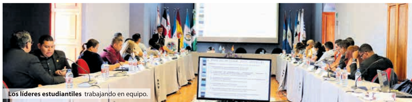
Los líderes estudiantiles trabajando en equipo.

El evento se llevó a cabo en la ciudad de Antigua Guatemala, declarada Patrimonio Cultural de la Humanidad por la Organización de las Naciones Unidas para la Educación, la Ciencia y la Cultura (UNESCO).