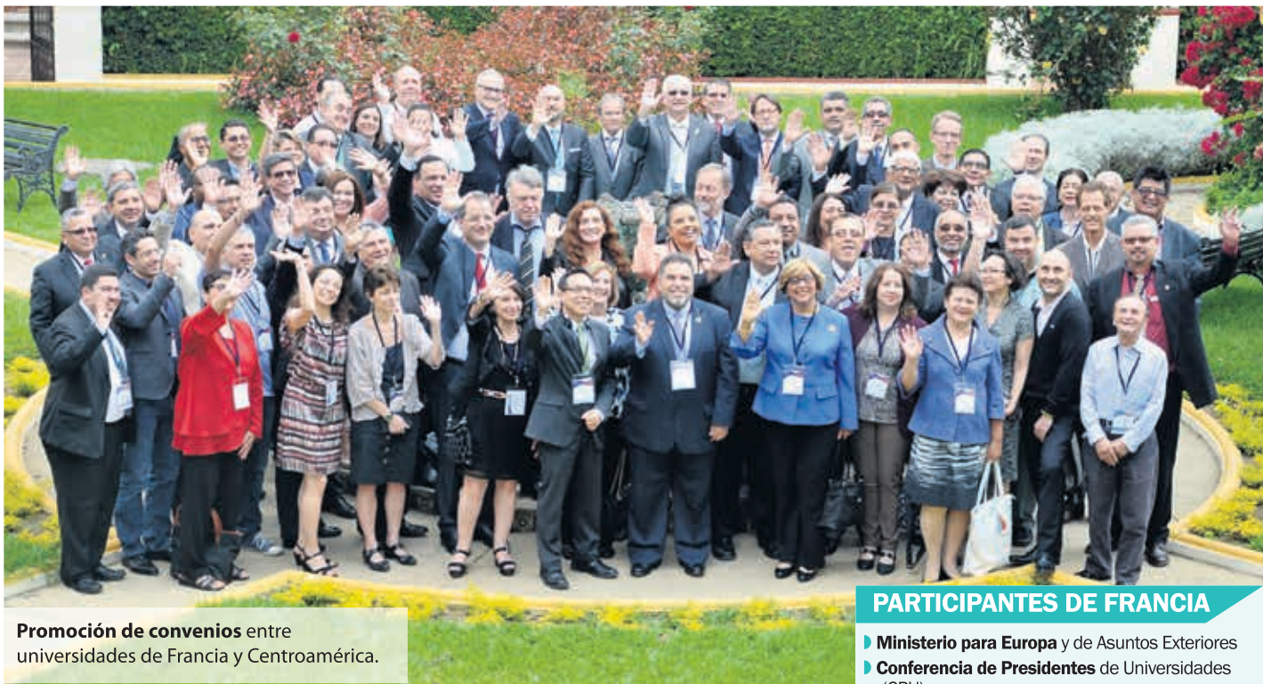
Promoción de convenios entre universidades de Francia y Centroamérica.

Durante la reunión, el embajador de Francia en Guatemala, Jean-Hugues Simon-Michel, mencionó: “Se tiene el privilegio de trabajar de la mano con la universidad más importante de Centroamérica y la más antigua: la Universidad de San Carlos de Guatemala, que representa a alrededor de 230,000 estudiantes en el país. El objetivo de este encuentro es abordar la importancia de la cooperación académica