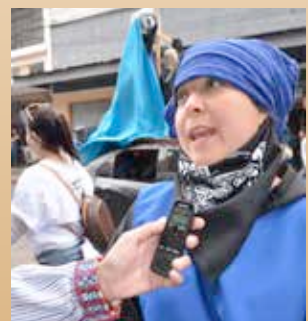
Engasada (pseudónimo), Escuela de Ciencias de la Comunicación