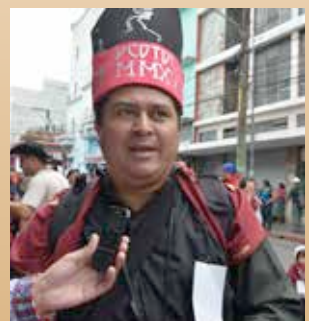
Parrocomunicacho Consolano del Trino del Chompipe, ex rey feo universitario