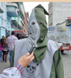
La Puta (pseudónimo), Escuela Superior de Arte

* Primer Rey Feo Vitalicio ** Segundo Rey Feo Vitalicio *** Tercer Rey Feo Vitalicio (+) Fallecido.