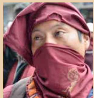
Rata, miembro del Frente Estudiantil Sancarlista (FES)